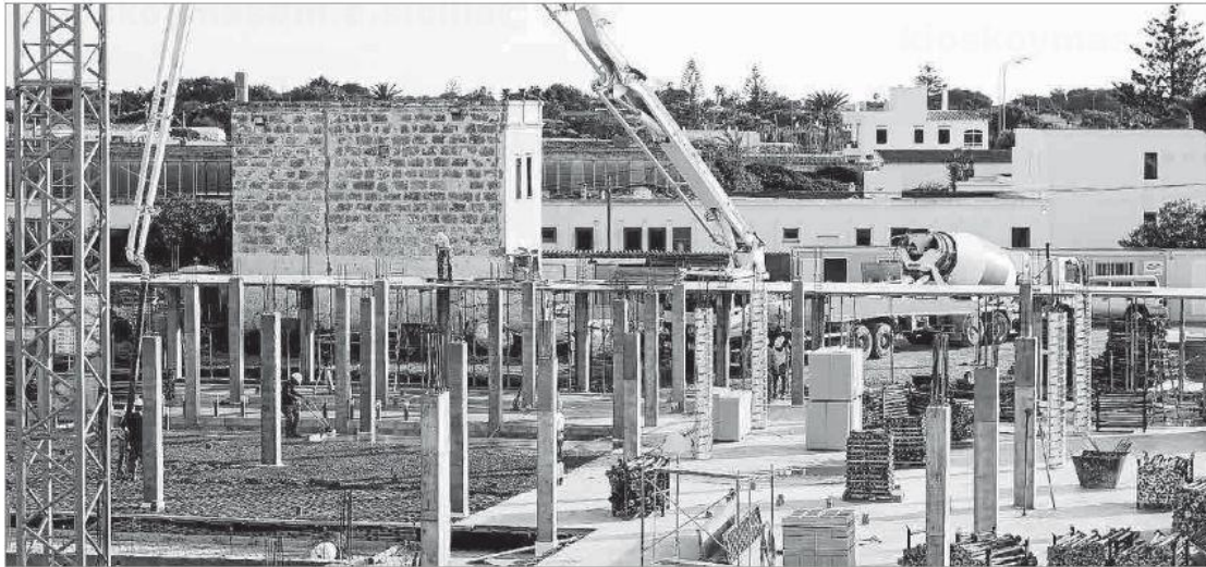
Trabajos de construcción de la Clínica Juaneda en Ciutadella, una de las obras en ejecución más voluminosas de Menorca en 2021.