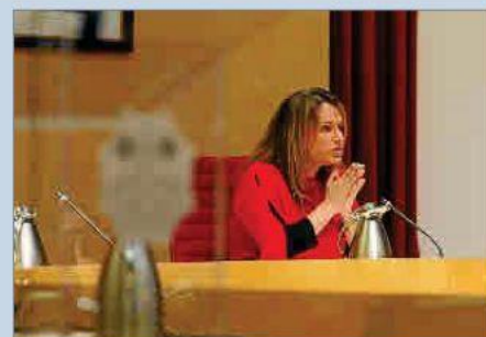
La presidenta del Consell, durant el pleno de ayer.