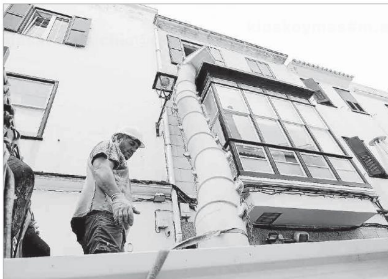
Un operario trabaja en la descarga de material de una vivienda en el centro de Maó.